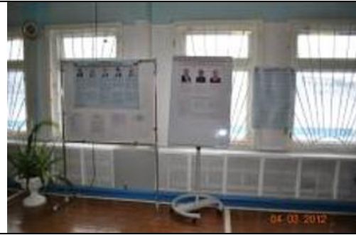
Фотография информационного стенда, используемого УИК для проведения голосования