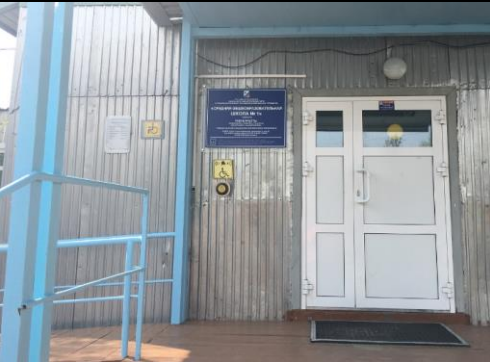
Фотография кнопки вызова