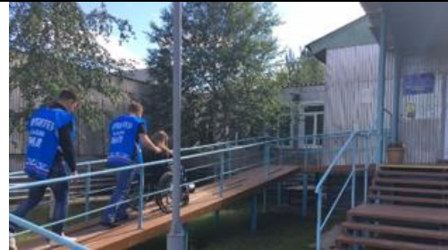
Фотография стационарного пандуса