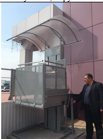
Фотография подъемного устройства