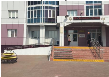
Фотография пандуса, контрастных лент для ступеней, поручней