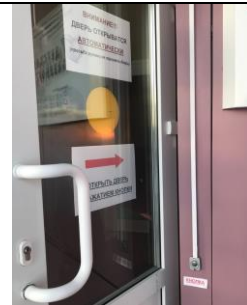
Фотография кнопки автоматического открывания дверей