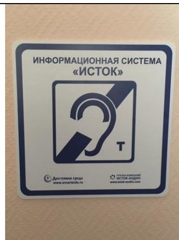
Фотография знака «Информационная система «ИСТОК»