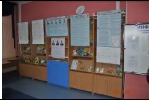
Фотография информационного стенда, используемого УИК для проведения голосования