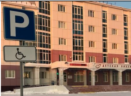
Фотография знака стоянки для автотранспорта для инвалидов, пандуса, поручней, световых маяков, бегущей строки