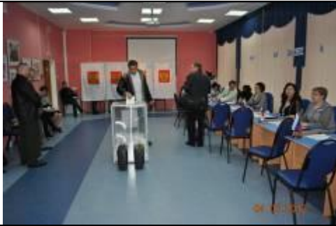
Фотография внутреннего помещения для голосования