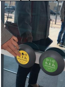
Фотография кнопки вызова помощника