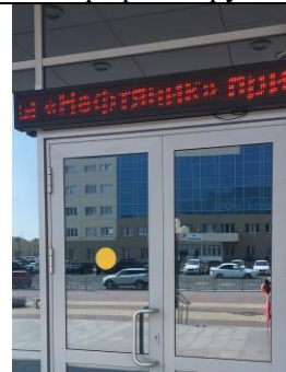
Фотография желтого знака на входной группе