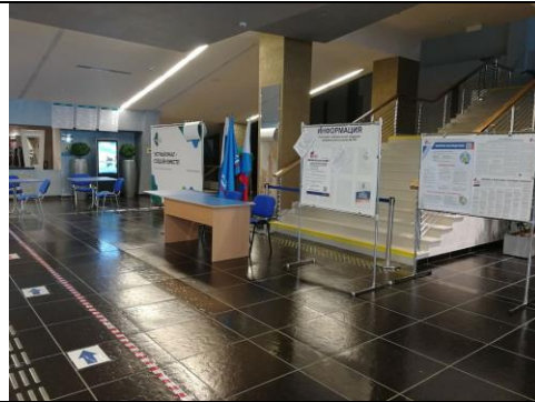
Фотография информационного стенда, используемого УИК для проведения голосования