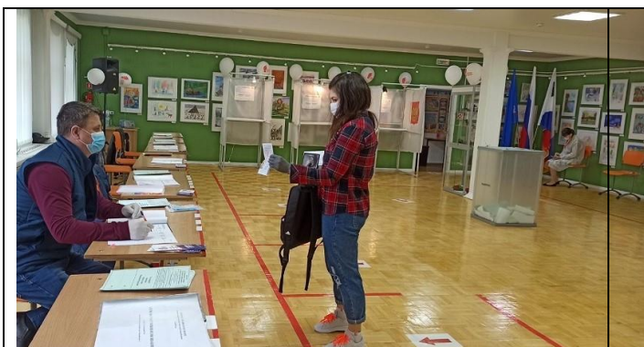
Фотография внутреннего помещения для голосования