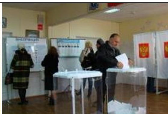
Фотография информационного стенда, используемого УИК для проведения голосования