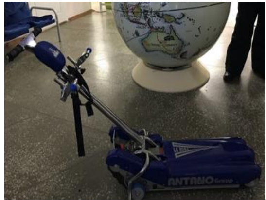
Фотография мобильного лестничного подъемника