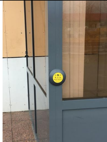
Фотография кнопки вызова помощника