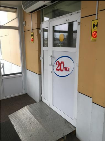
Фотография порога, желтых кругов