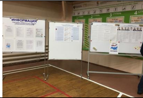
Фотография размещения информационных стенов