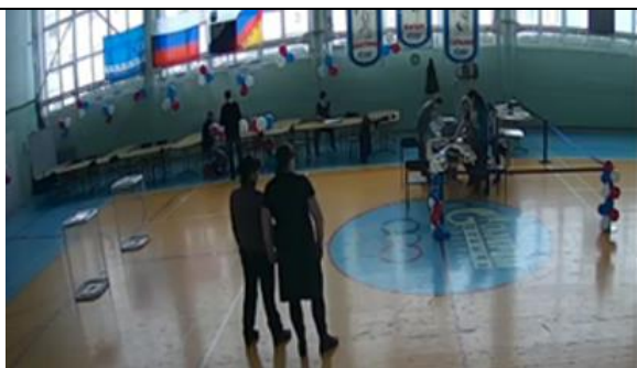
Фотография внутреннего помещения для голосования