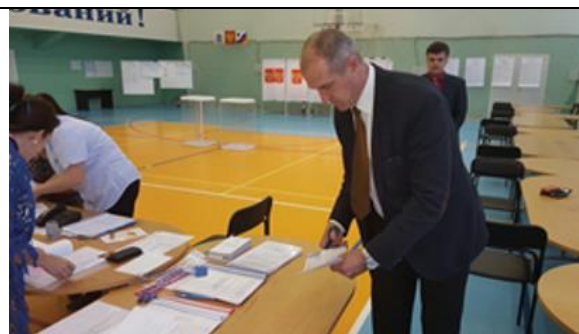
Фотография помещения для голосования, информационных стендов, используемых УИК