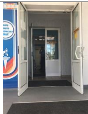
Фотография противоскользящего покрытия, желтых наклеек на дверь