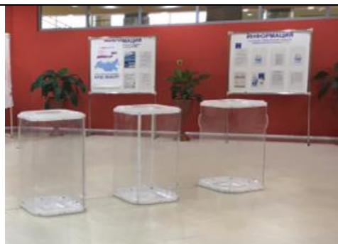
Фотография информационного стенда, используемого УИК для проведения голосования