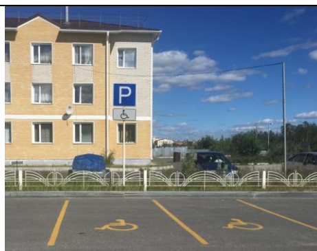
Фотография знака стоянки автотранспорта для инвалидов